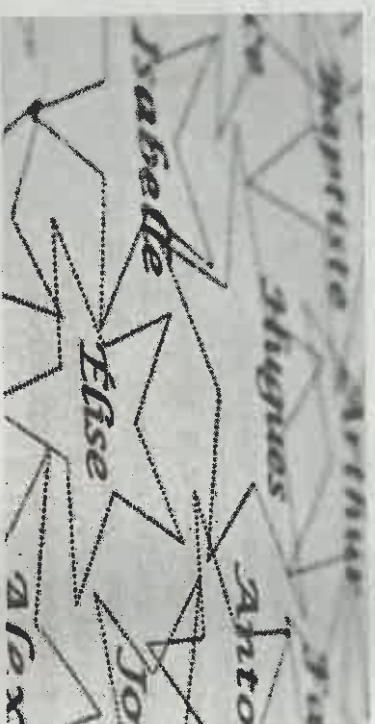
Une étoile pour chaque enfant.

Le site internet de l'association est également un lieu d'échange important avec une partie forum et un hommage à chacun des enfants.