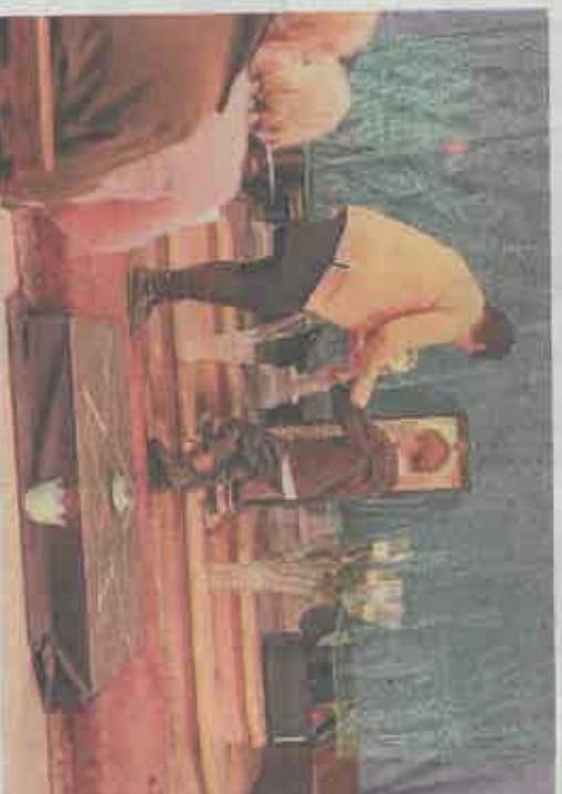
Une cérémonie particulièrement émouvante, qui rassemble des personnes ayant traversé l'épreuve de la perte d'un enfant.